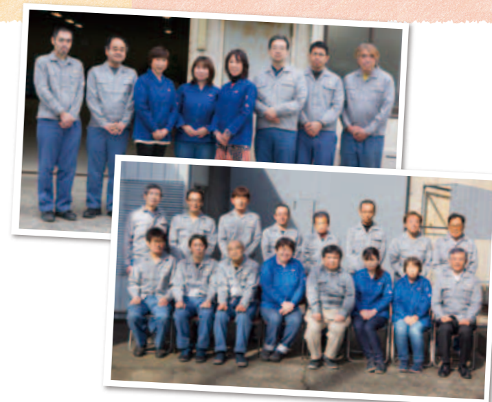
※写真撮影のために一時的にマスクを外しています

この借換えは、黒字化が実現できた一因となりましたし、困っているときこそ力になってくれる信用保証協会を頼もしく、また親身に考え行動して下さることをありがたく思っています。