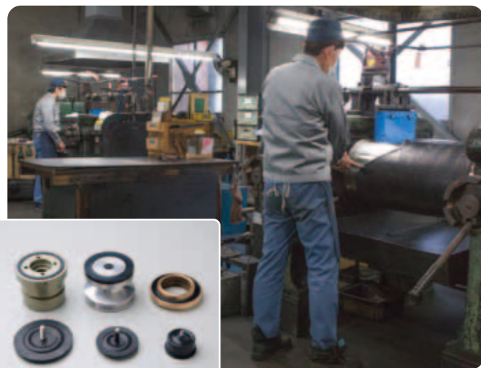
『金属とゴム』の複合部品

品質に対して妥協しないからこそ生まれる信頼 感謝の気持ちを胸に皆さまと歩む未来へ